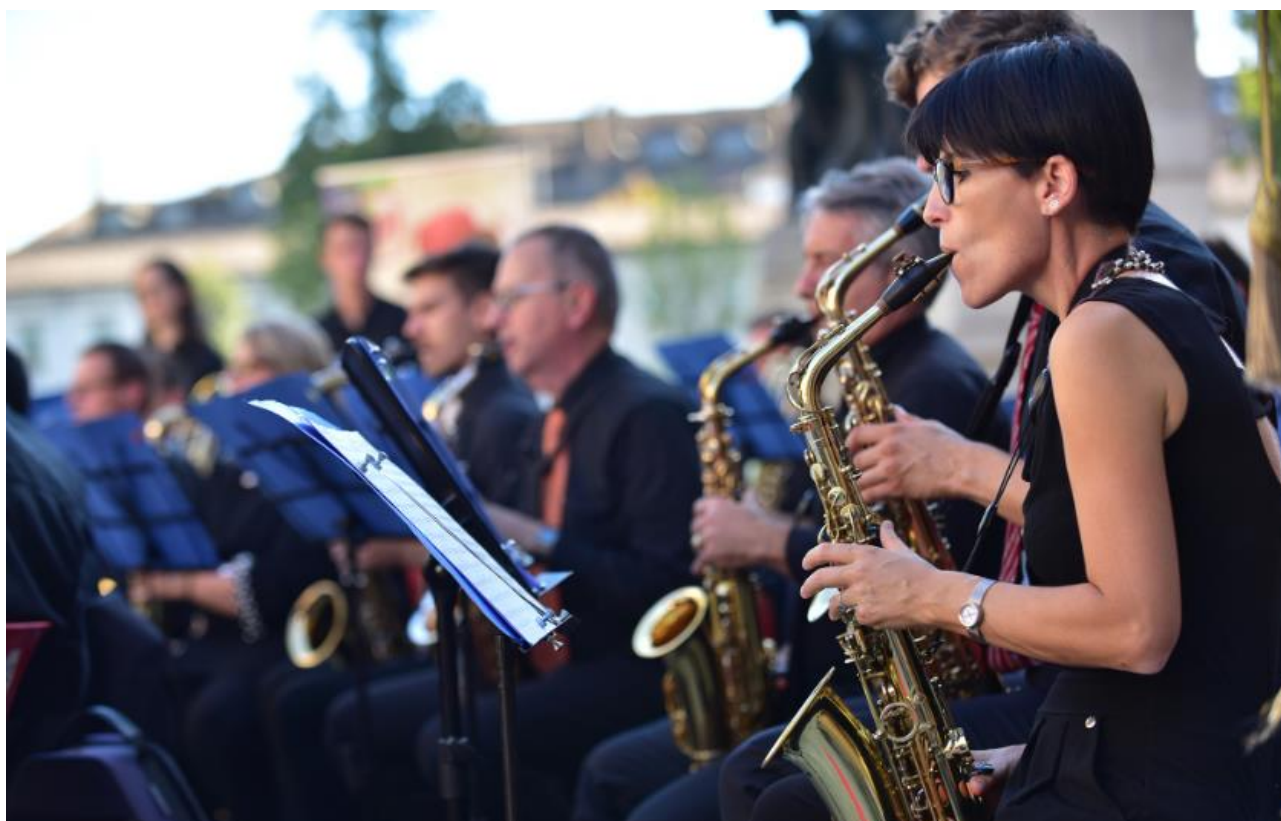
Festival Verdi Orchestra Fiati Portogruaro Piazza della Pace, Parma, 02/10/2022